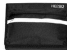
Veske Til armlene