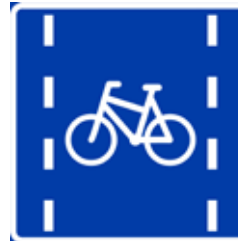
Sykkelfelt på vei