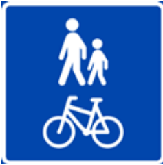
Gang- og sykkelvei

Skiltene nedenfor forteller hvor du kan kjøre elektriske scootere fra Hepro