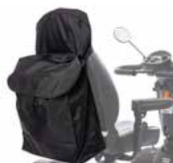
Veske til seterygg Henges på nakkestøtte