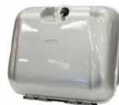
Vareboks universal Med feste