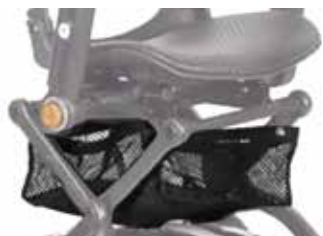
Varenett under sete S19V