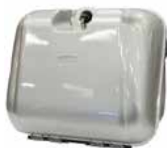
Vareboks Med feste til HS-928C