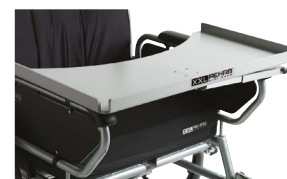
Bord (for setebredde 55-72 cm)