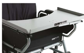
Bord (for setebredde 55-72 cm)