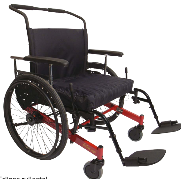
Eclipse rullestol er kollisjonstestet

Puter bestilles separat, se tilbehør på side 18.